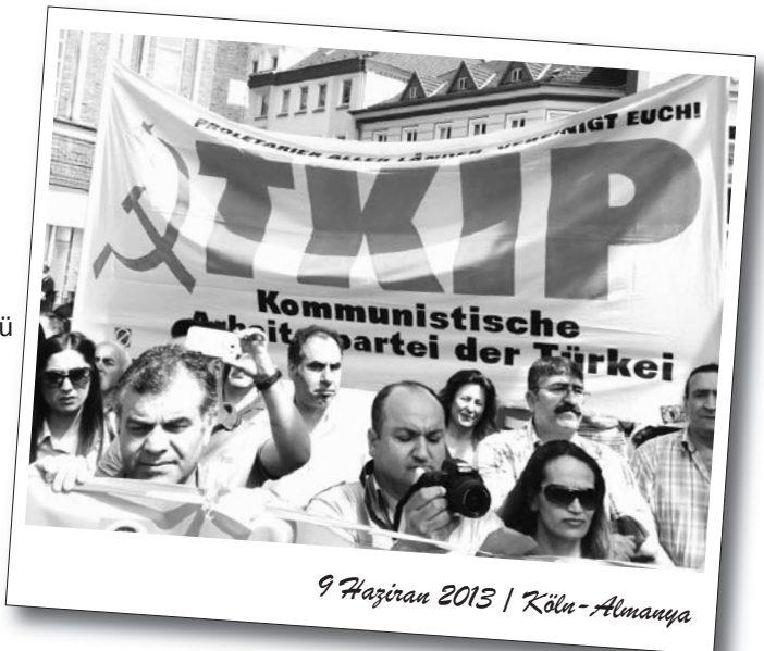
9 Haziran 2013 | Köln-Almanya