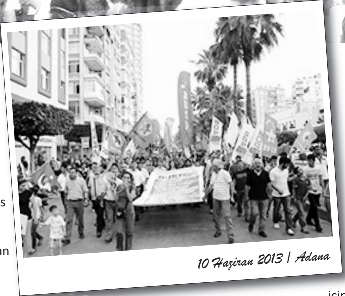
10 Haziran 2013 | Adana

Ankara'da Kennedy Caddesi başta olmak üzere Kızılay'a çıkan noktalarda çatışma şiddetle sürerken Mamak'tan Sincan'a emekçiler gericiliğin hakim olduğu yerlerde bile talepleri