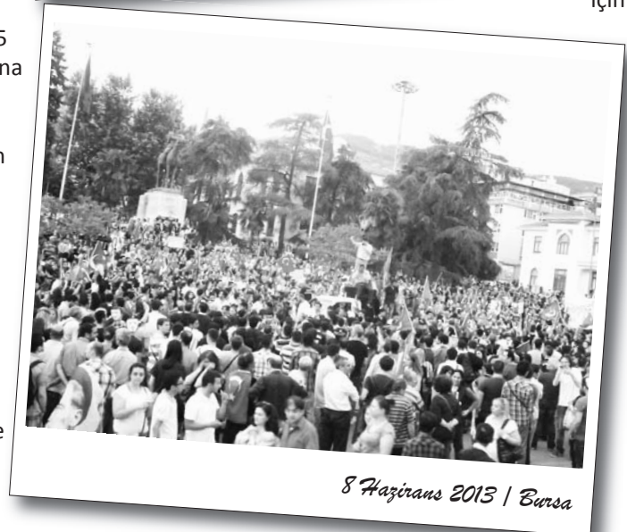
8 Haziran 2013 | Bursa