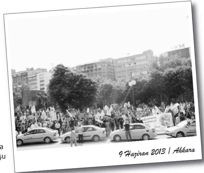
9 Haziran 2013 | Ankara

Çorlu’da işçi, emekçi ve gençlik Çorlu Heykel Meydanı’nda toplandı. Kitle şarkı ve türküler eşliğinde coşkulu sloganlar atarken program başlatıldı. Kürsüden