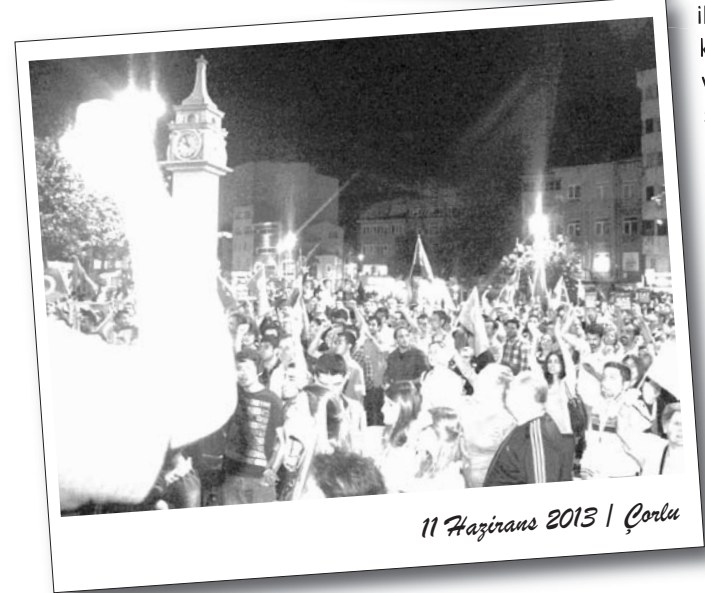
11 Haziran 2013 | Çorlu