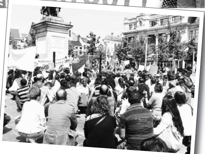
9 Haziran 2013 | Belçika

Frankfurt'ta hem Türkiye'deki eylemlerle dayanışmak ve hem de Frankfurt'taki polis