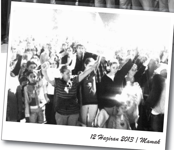
12 Haziran 2013 | Mamak

BDSP de yürüyüş güzergahına "Ya barbarlık ya sosyalizm!", "Çözüm devrimde kurtuluş sosyalizmde!",